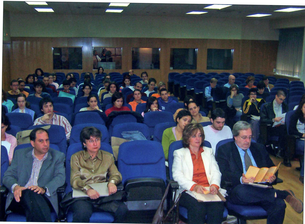
Aspecto general del salón de actos.

y organización de este encuentro cultural y animando a la organización para que se sigan celebrando estas jornadas en futuras ediciones.